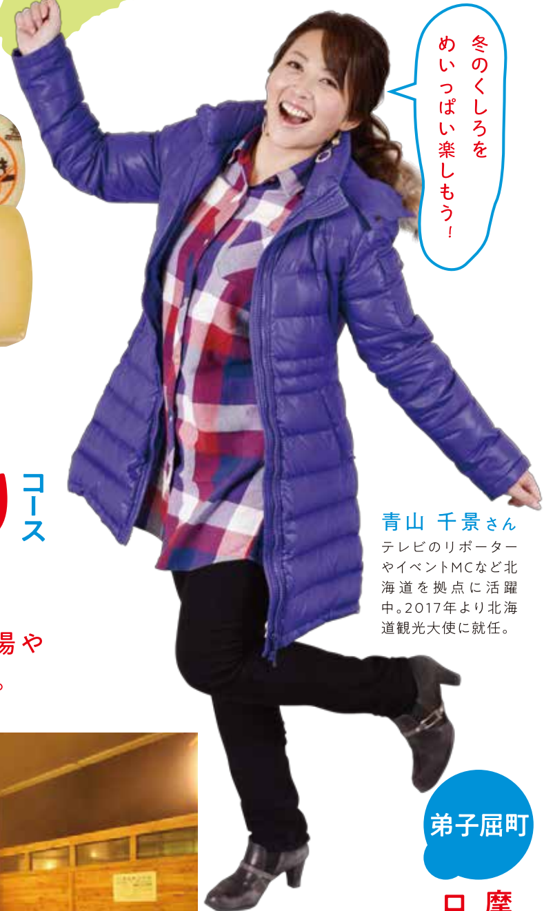
【協力】道の駅 しらぬか恋問 白糠郡白糠町恋問3-3-1 TEL.01547-5-3317

白糠町産のナチュラルチーズや特産品などが揃う道の駅。大事な人や自分へのお土産を選んで。