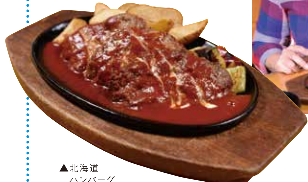
▲北海道 白糠産ハンバーガー

地元愛たっぷりのハンバーガー 白糠産のエゾシカ肉・白糠の茶路めん羊牧場産のラム肉・道産牛と阿寒ポークの合い挽き肉のハンバーガーを一度に味わえる逸品。それぞれの肉の違いを感じて。