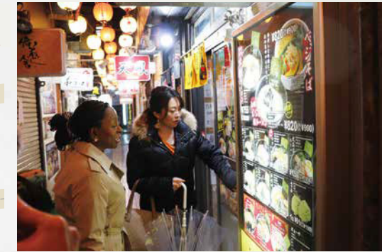
▲店横の看板メニューでオーダーを決めた2人