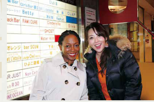
▲サイバーシティビルの玄関前、メイドバーにワクワク